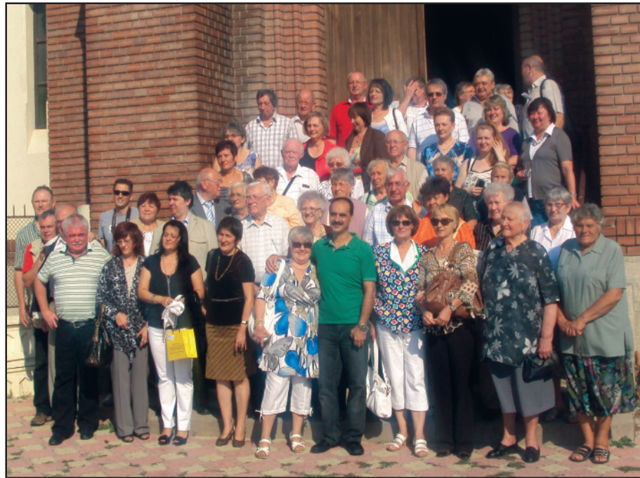
fotografii ca să le arate lăcașul lor de rugăciune din trecut, rudelor rămase în Germania. După liturghie, foștii recășeni s-au plimbat prin oraș,